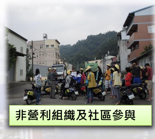
非營利組織及社區參與