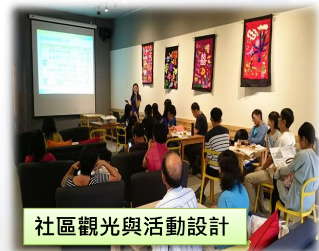
社區觀光與活動設計