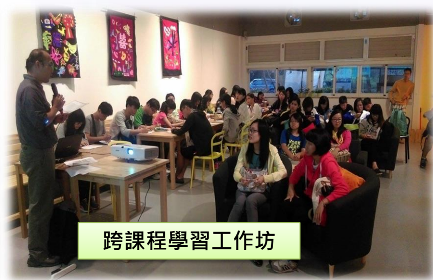
跨課程學習工作坊