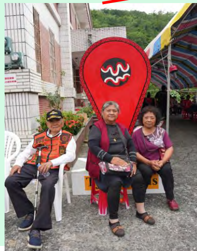
來義鄉公所來義村辦公處