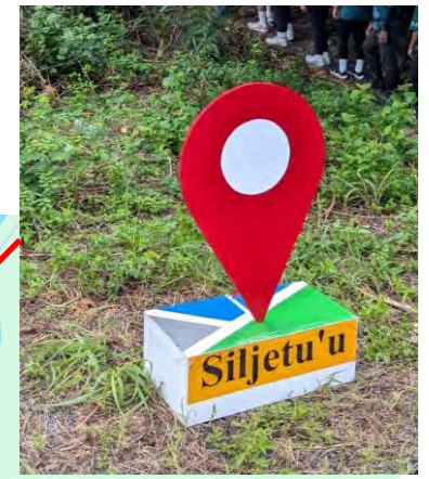
加拉阿夫斯(舊來義)