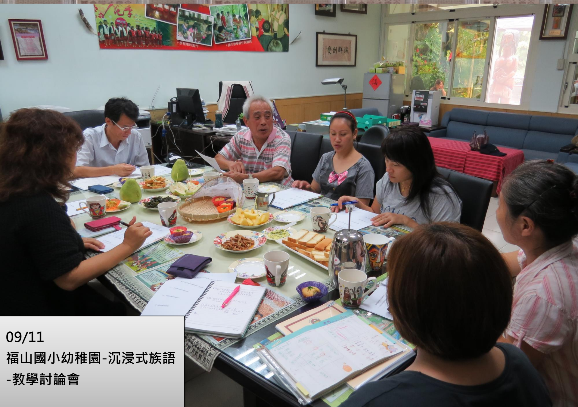
09/11 福山國小幼稚園-沉浸式族語 -教學討論會