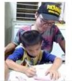
Children Workshop in Guangfu