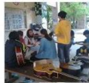
Hodong Holiday Creative Arts School