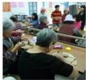
Accompany Learning: The Elderly Drawing-talking Class