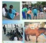
Nan-Hua Horse Adoption-Guidance